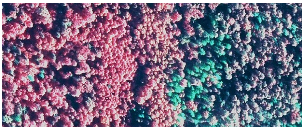
Rys. 1. Martwe świerki (kolor jasnozielony) w Puszczy Białowieskiej na zdjęciu lotniczym (CIR).

Zaburzenia funkcjonowania ekosystemów leśnych w postaci naturalnych czynników i zjawisk dotyczą coraz częściej obszarów zalesionych (Millar i Stephenson 2015), w wielu przypadkach powodując wysoką śmiertelność drzew (Seidl i in., 2014) (ryc. 1). Masowe zamieranie drzew i drzewostanów niesie ze sobą nie tylko ogromne konsekwencje ekologiczne i ekonomiczne, ale także w niektórych, szczególnych przypadkach może stanowić bezpośrednie zagrożenie dla życia ludzkiego. Duża liczba martwych drzew stojących w lesie pełniącym funkcję rekreacyjną, atrakcyjnym turystycznie, stanowi potencjalne zagrożenie, nie tylko dla ludzi w nim pracujących, ale też turystów i innych osób korzystających z lasów.