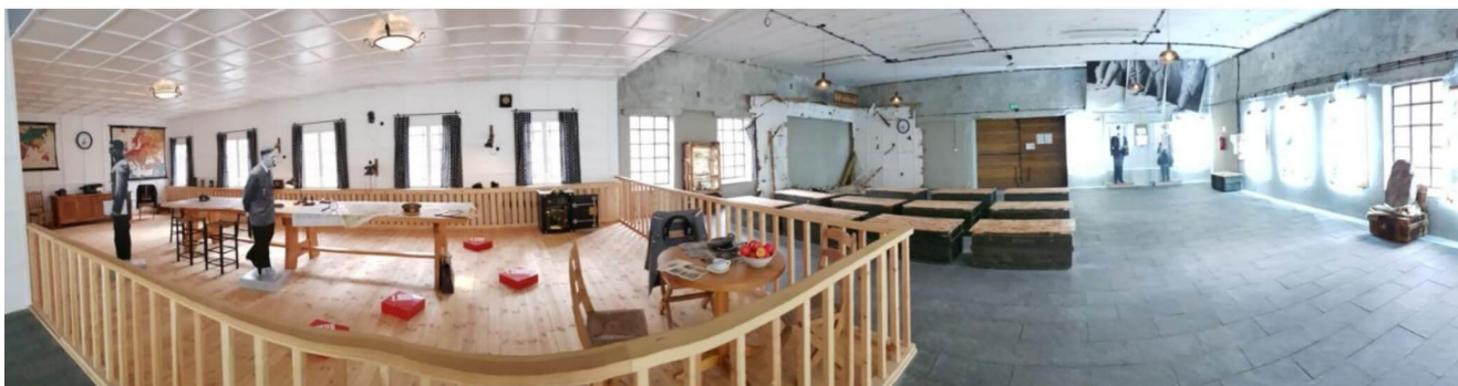
Ryc. 3 Przykłady zastosowania multimediiów w StoryMaps (tekst ze zdjęciami archiwalnymi, film, zdjęcie panoramiczne).

Wygląd stylistyczny całego projektu można dostosować do tematyki prowadzonej narracji. Jednym kliknięciem istnieje możliwość zmiany kolorystyki, czcionek i innych elementów związanych z wyglądem całości. Można użyć zdefiniowanych systemowo motywów lub sprofilować swój indywidualny wzór, co dodatkowo poszerza możliwości wizualnej ekspresji.