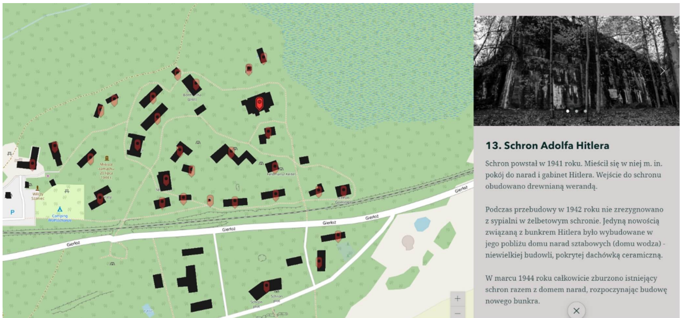
Ryc. 1 Mapa na której po kliknięciu w obiekt pojawia się informacja z multimediami.

Mapa może stanowić oś narracji. Dodatkowe jej uzupełnienie o inne multimedia (fotografie, filmy itp.) może zaważyć o atrakcyjnym wyglądzie całego projektu. Uzupełnienie całości poprzez dodanie tekstu, który również może być wizualnie dostosowywany do kontekstu poprzez zastosowanie pogrubień, kursyw, większej lub mniejszej czcionki itp. powoduje, że dostępne narzędzia dają wiele możliwości przekazania użytkownikowi swoich informacji.