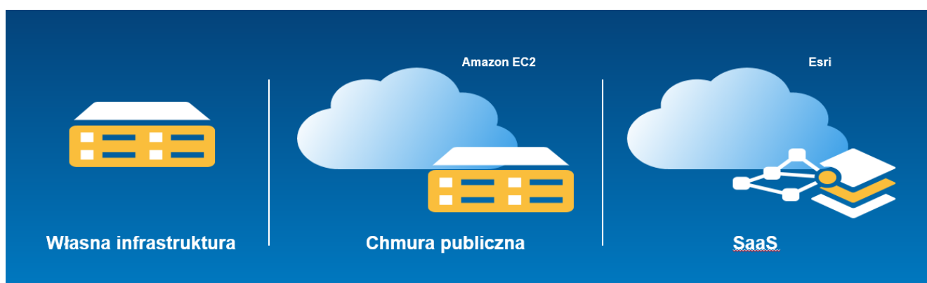
Rys. 2. Strategie wdrażania platformy ArcGIS

Nie tylko użytkownicy, ale i organizacje znacząco różnią się między sobą. W zależności od wymagań platforma może być wdrożona na własnej infrastrukturze organizacji, w chmurze publicznej (np. Amazon Cloud) lub w chmurze Esri jako ArcGIS Online (usługa Software as a Service – SaaS, Rys. 2).