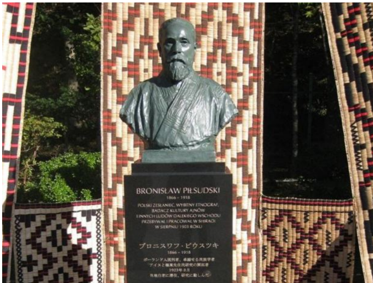
Rys. 4. Odsłonięcie pomnika Bronisława Piłsudskiego w 2013 r. w Muzeum Ajnów na wyspie Hokkaido.