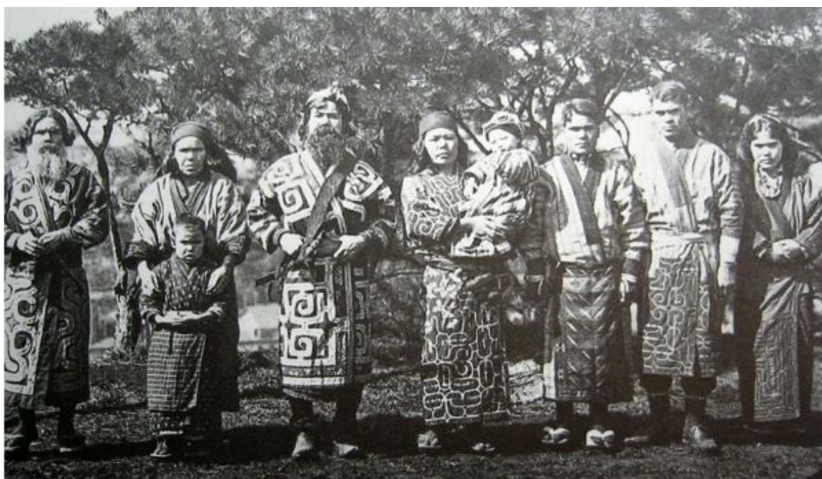
Rys. 3. Przedstawiciele ludu Ajnów.

Znaczna część szlaku prezentuje badania, które przysporzyły popularności B. Piłsudskiemu. Dotyczyły one między innymi badań ludu Ajnów. Znamienne jest to, że udało mu się między innymi nagrać ich mowę – co było na owe czasy znacznym osiągnięciem oraz opracować słownik ich języka.