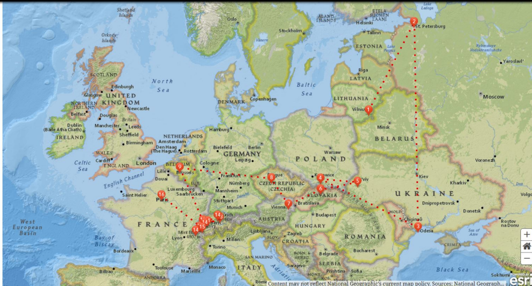
Rys. 1. Mapa podróży Bronisława Piłsudskiego po Europie

Etap „Zesłanie” przedstawia okres życia bohatera fabuły związany z pobytem na katordze. Narracja rozpoczyna się od archiwalnej fotografii na której został przedstawiony moment rozładunku statku „Niżny Nowograd” w porcie Aleksandrowsk na Sachalinie. W dalszej części zostały opisane i przedstawione miejsca, związane z działalnością zesłańcą. Lokalizacje w których przebywał Bronisław Piłsudski zostały zaprezentowane na mapach, gdzie każda lokalizacja została wyraźnie wyróżniona.