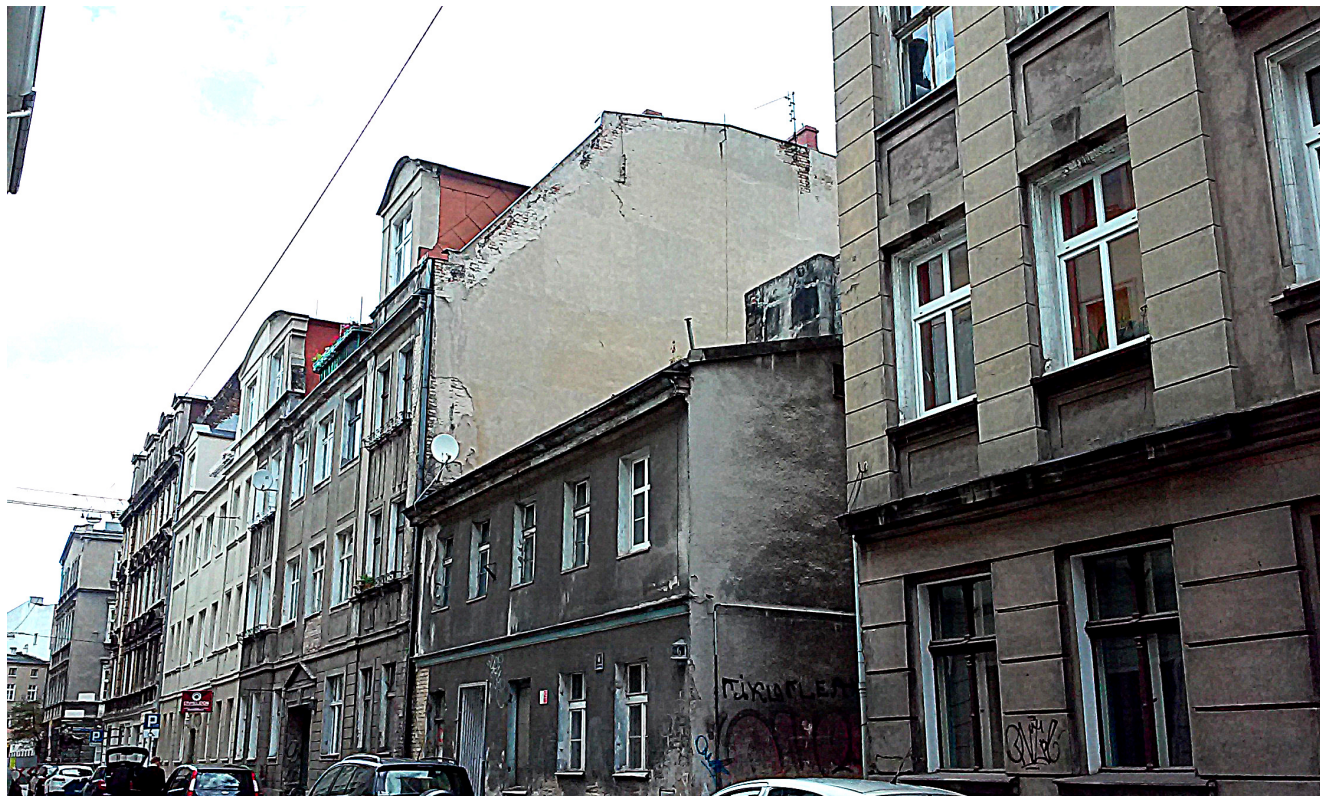
Fot. 1. Zaniedbana kamienica na ulicy Za Bramką jako stymulant koncentracji przestępczości, wykonane własne 08.09.2015

dzięki czemu maleje anonimowość sprawców przestępstw. Obszary występowania dużej liczby przestępstw pokrywają się z obszarami występowania, często zaniedbanej, zabudowy kamienicznej oraz słabo oświetlonych ulic.