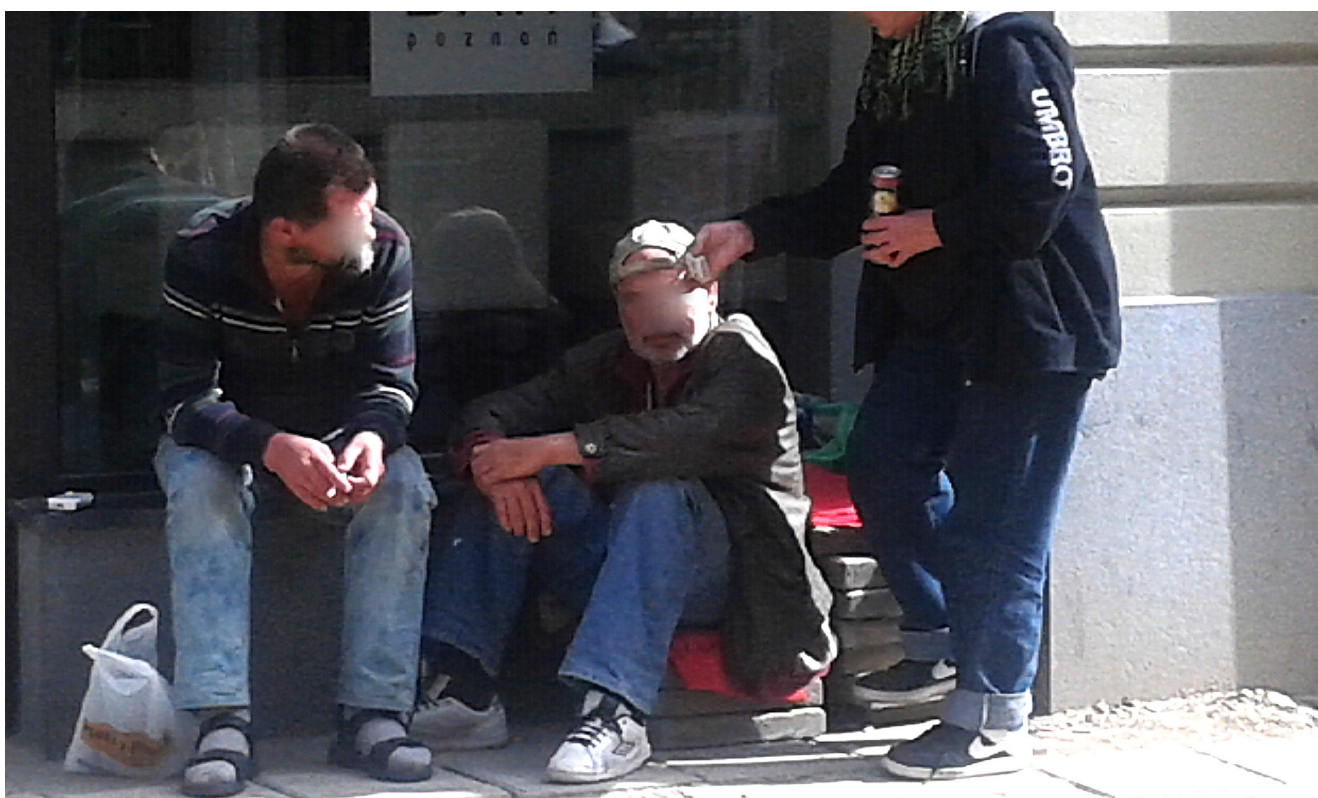
Fot. 2. Osoby prawdopodobnie bezdomne i bezrobotne, spożywający alkohol na ulicy Wrocławskiej, 15.09.2015

obecności monitoringu wizyjnego, mimo, że na terenie Poznania działa 605 kamer. Istotnym czynnikiem wpływającym na popełnianie przestępstw jest bezrobocie – odsetek ogólnej liczby przestępstw popełnianych w poszczególnych dzielnicach jest proporcjonalny do liczby zarejestrowanych w nich bezrobotnych.