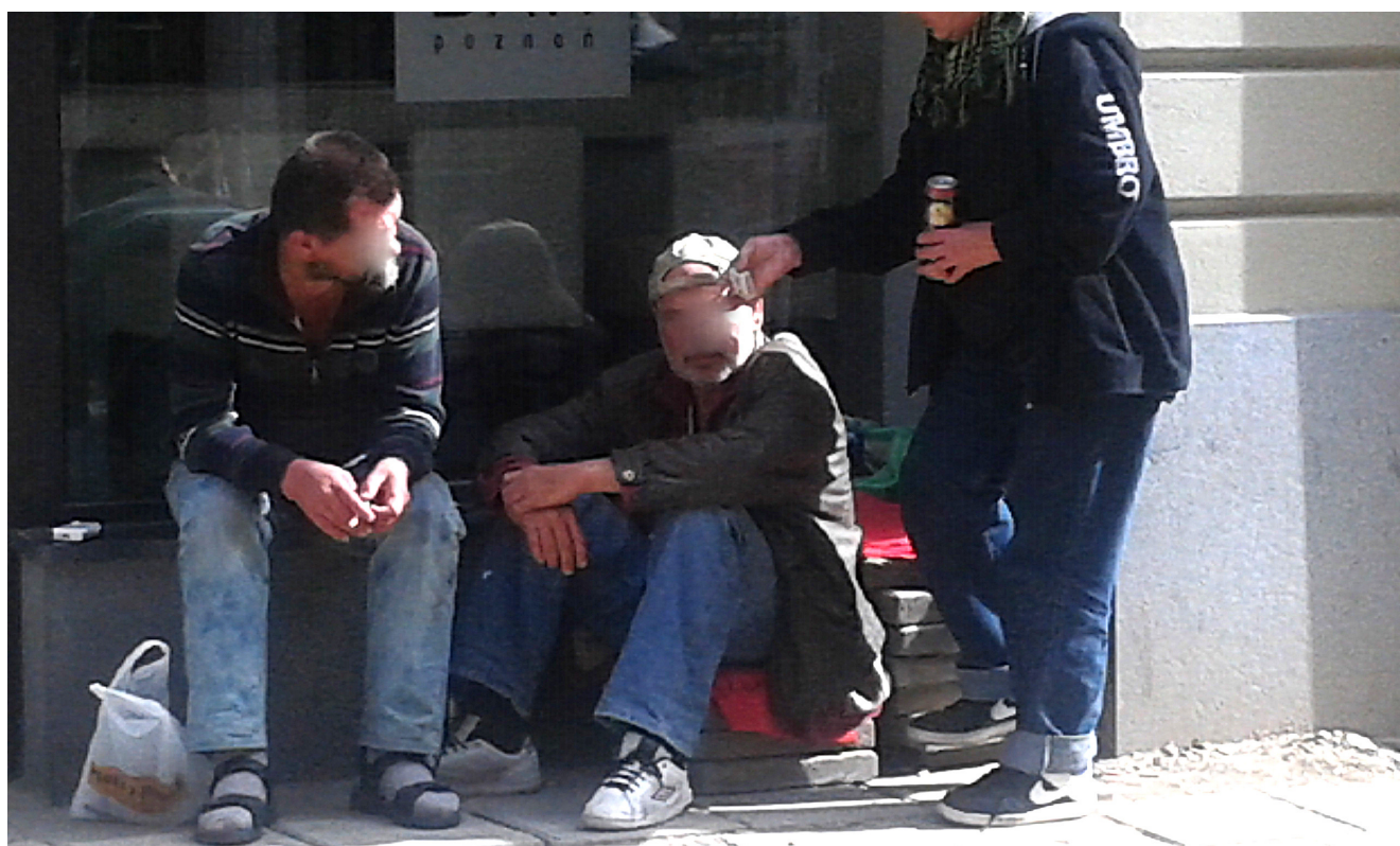
Fot. 2. Osoby prawdopodobnie bezdomne i bezrobotne, spożywający alkohol na ulicy Wrocławskiej, wykonanie własne 15.09.2015

obecności monitoringu wizyjnego, mimo, że na terenie Poznania działa 605 kamer. Istotnym czynnikiem wpływającym na popełnianie przestępstw jest bezrobocie – odsetek ogólnej liczby przestępstw popełnianych w poszczególnych dzielnicach jest proporcjonalny do liczby zarejestrowanych w nich bezrobotnych.