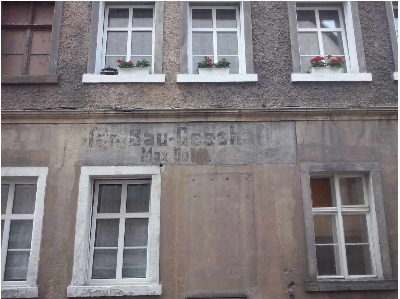
Rys. 7. Szyld sklepu – niegdyś w posiadaniu pana Maxa, Lwówek Śląski.