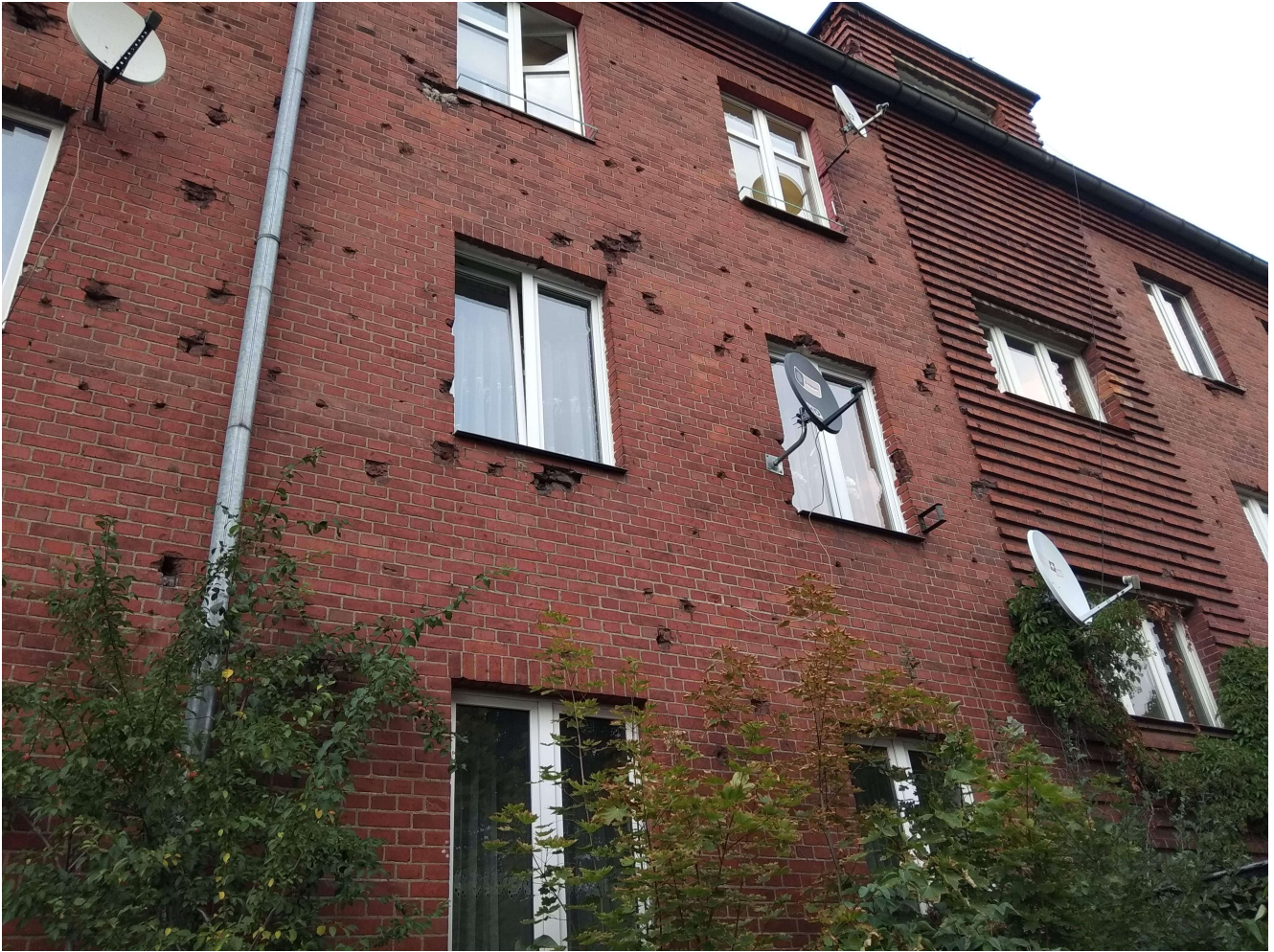
Rys. 3. Zniszczona elewacja budynku – przykład śladów walk, ul. Hallera.