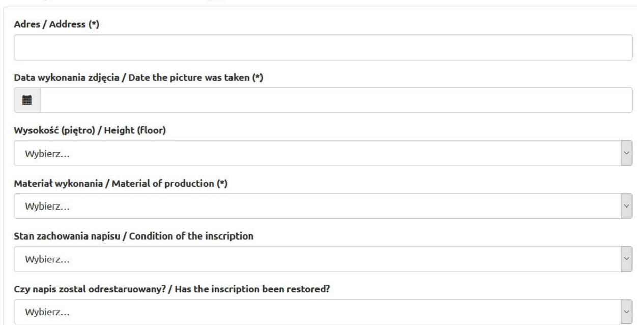
Rys. 6. Fragment Formularza Geograficznego (GeoForm) „Echa