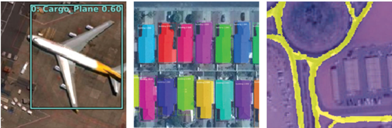
Rys. 4. Wyniki różnego rodzaju przetwarzania obrazów z wykorzystaniem Deep Learning: wykrywanie obiektów (po lewej), klasyfikacja obiektów (w środku) i klasyfikacja pikseli (po prawej).

klas. Modele przeznaczone do klasyfikacji pikseli obrazu to: U-Net, Pyramid Scene Parsing Network (PSPNET) oraz DeepLabV3.