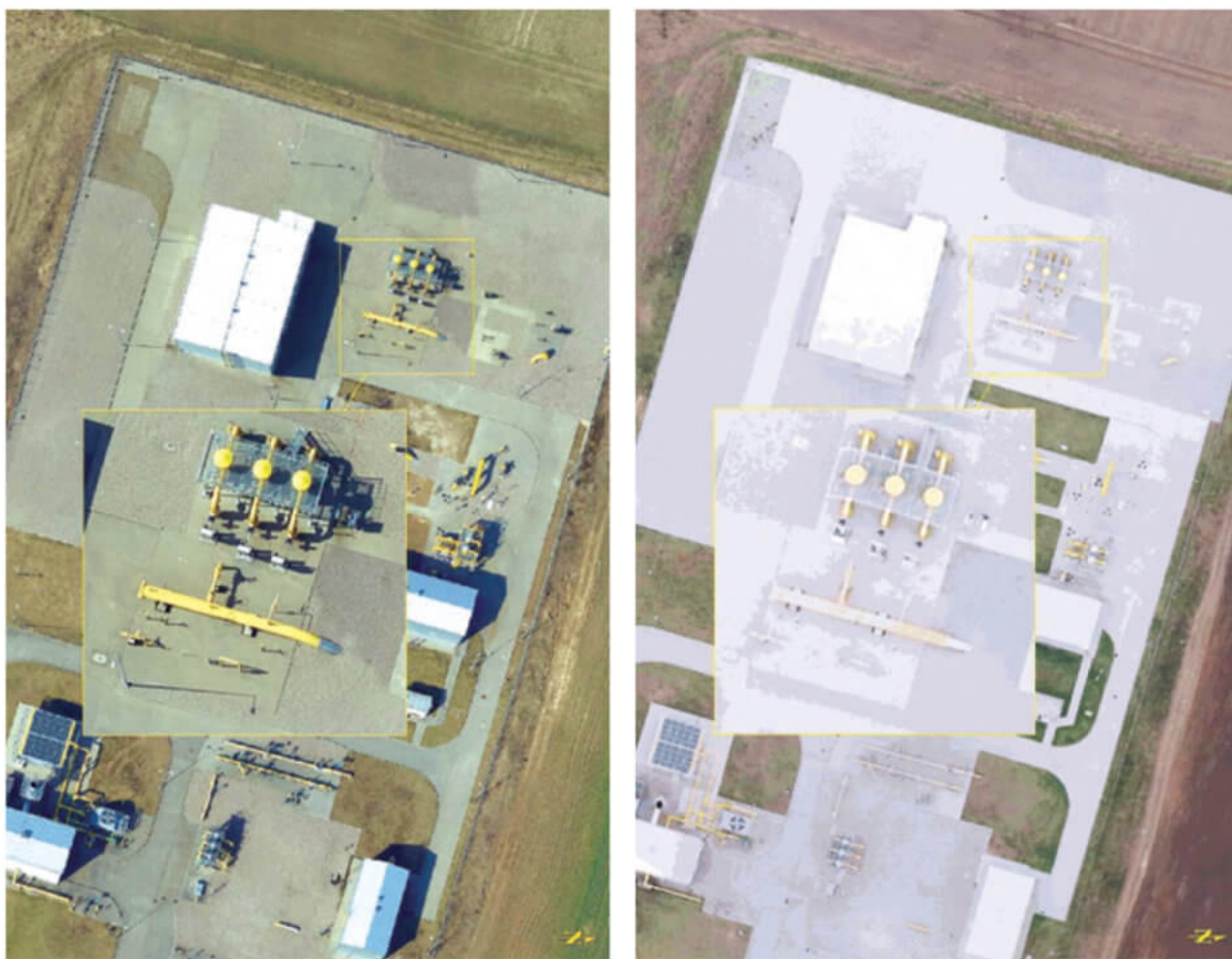
Rys.1: Porównanie zobrazowań RGB (po lewej) i zobrazowań wykorzystujących paletę barw Colormap (po prawej)

Poza opisanymi wyżej ortofotomapami przekazano 2 ortofotomapy opracowane na podstawie zdjęć pozyskanych przez pracowników GAZ-SYSTEM przy pomocy bezzałogowych statków lotniczych.