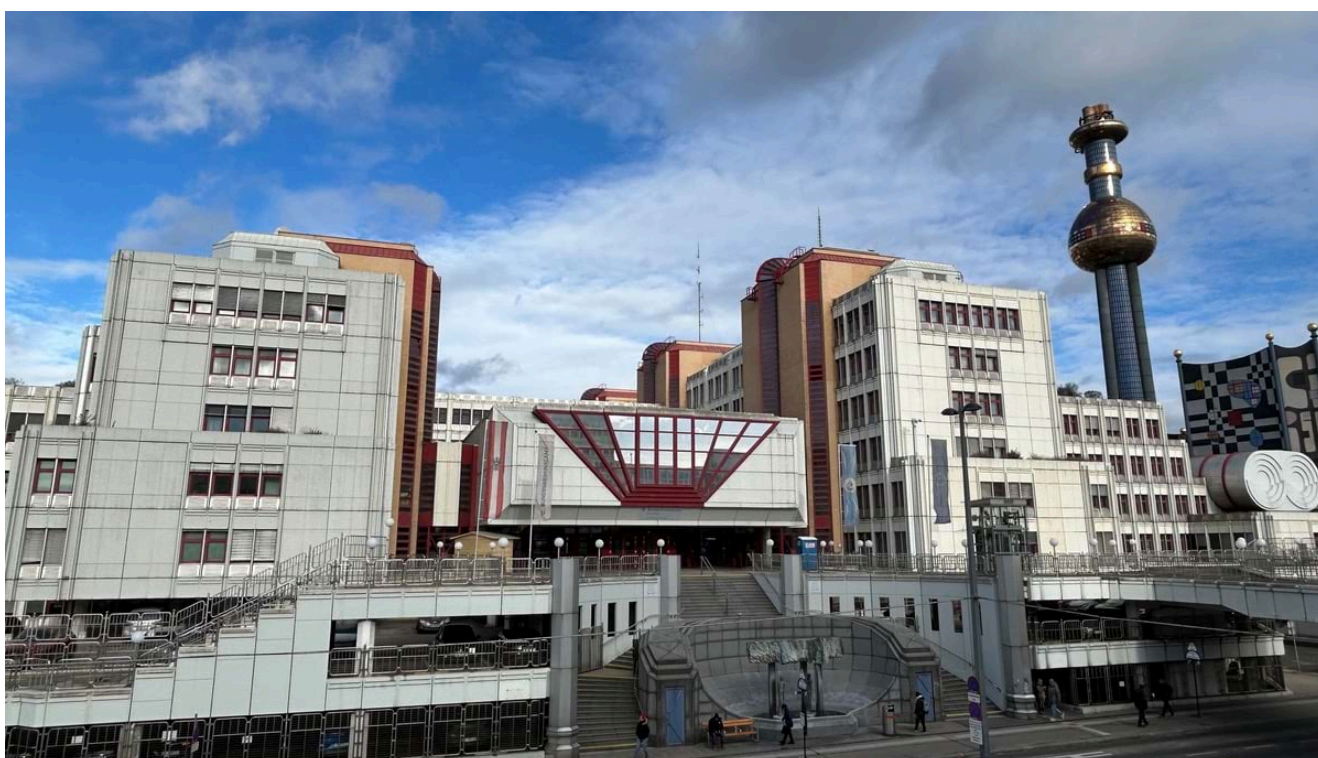
Kryminalna Służba Wywiadowcza Austrii (Bundeskriminalamt lub

Wszystko, co robi policja „może być objęte tą platformą” – dodał Huberty. „Śledczy, ludzie zajmujący się prewencją, każdy może wejść na tę platformę, aby uzyskać wszystkie potrzebne informacje”.