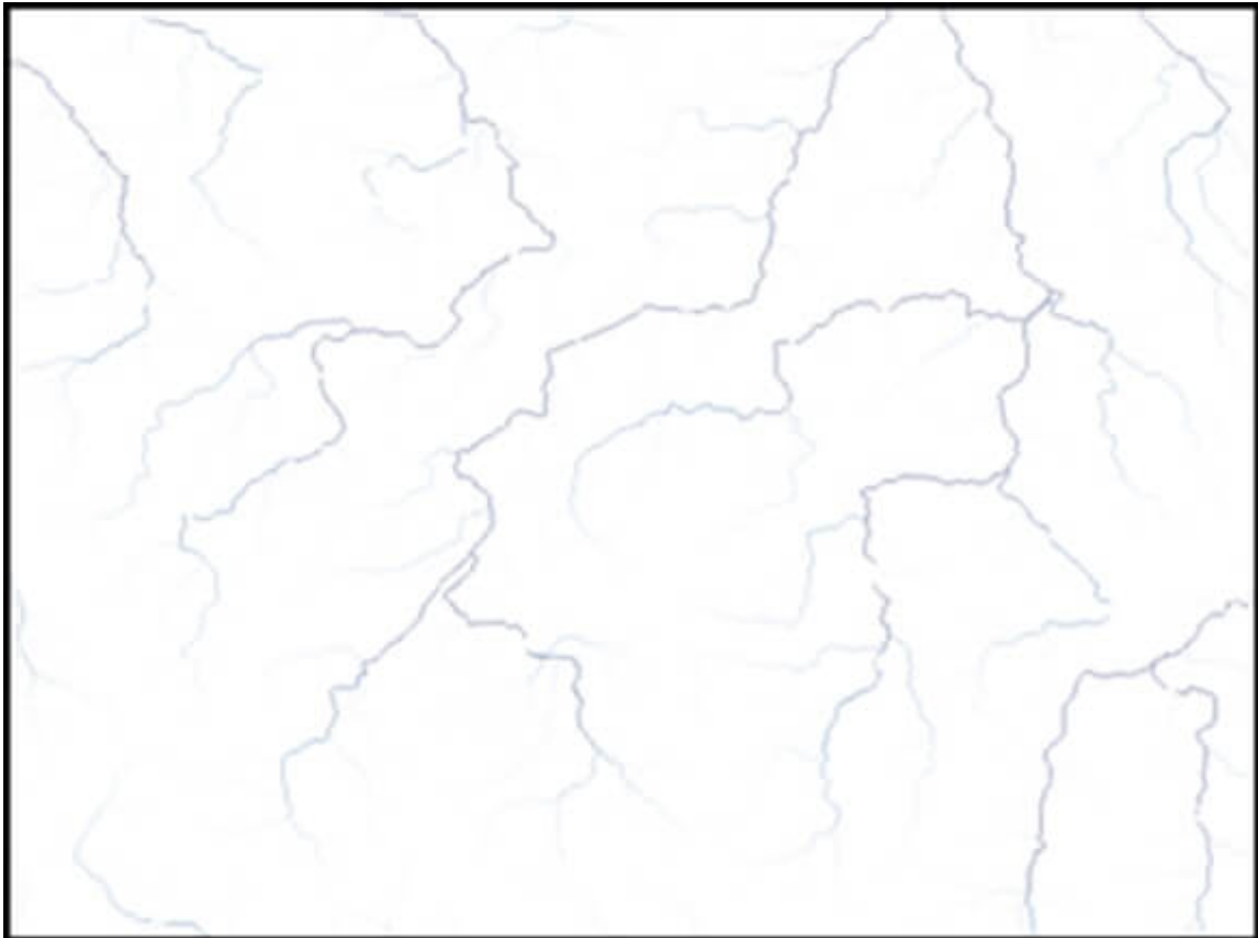
Rys. 2. Mapa rastrowa akumulacji przepływu.

Każda komórka mapy akumulacji przepływu przechowuje wówczas wartość, która odpowiada liczbie komórek, z których woda spływa do danej komórki. Istotną kwestią staje się w tym momencie określenie minimalnego progu akumulacji przepływu, od którego ma powstać rastrowa warstwa cieków. Możemy go zdefiniować i jednocześnie wygenerować ciekę za pomocą narzędzia Stream definition w ArcHydro Tools. Przyjmuje się, że wartość ta powinna oscylować w zakresie od 0,5 do 1 proc. maksymalnej wartości akumulacji przepływu, aby gęstość wygenerowanej sieci rzecznej oraz długość cieków były jak najbliższe rzeczywistości. Wartości tych jednak nie powinno się przyjmować bezkrytycznie, ponieważ na strukturę sieci rzecznej, poza samym ukształtowaniem terenu, wpływa również wiele innych czynników, takich jak budowa geologiczna czy warunki klimatyczne danego regionu.