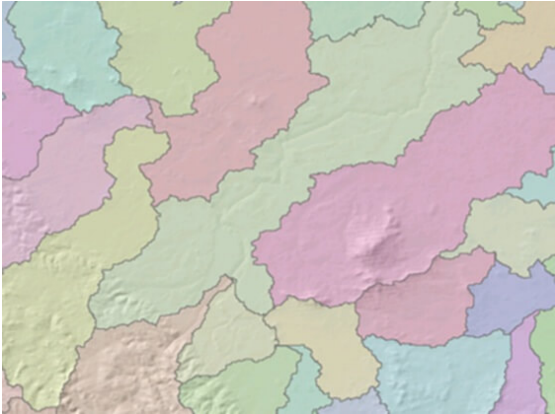
Rys. 3. Wyznaczone granice topograficzne wybranych zlewni.

Raster ten możemy łatwo przekonwertować do postaci wektorowej za pomocą narzędzia catchment polygon processing w ArcHydro Tools. Tego samego typu konwersję da się wykonać dla cieków, wykorzystując narzędzie drainage line processing . Tak jak wspomniano wcześniej, program generuje zlewnie automatycznie dla wszystkich cieków. Często zdarza się jednak, że zadanie polega na wygenerowaniu wyłącznie jednej zlewni dla wybranego cieku. W takiej sytuacji należy posłużyć się narzędziem watershed w Spatial Analyst, które pozwala na wyznaczenie działu wodnego do miejsca, w którym znajduje się profil zamykający zlewnię. Położenie profilu można zdefiniować np. na podstawie wektorowego zapisu sieci hydrograficznej (np. Mapy Podziału Hydrograficznego Polski). Wówczas należy stworzyć nową warstwę wektorową przedstawiającą profil zamykający zlewnię, która wraz z mapą kierunków przepływu stanowi dane wejściowe, niezbędne do uruchomienia narzędzia watershed . Po wygenerowaniu mapy rastrowej akumulacji przepływu na podstawie rastra kierunków przepływu można zauważyć, że profil